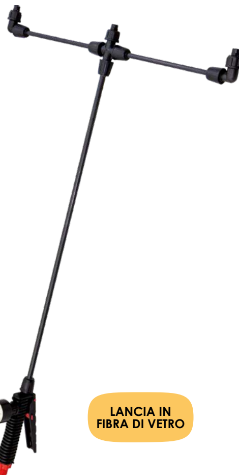
LANCIA IN FIBRA DI VETRO

Concepita per applicazioni su superfici di medie dimensioni è ideale per trattamenti indoor di disinfestazione, disinfezione e sanificazione in tutti i contesti come uffici, abitazioni civili e spazi comuni condominiali, dove è necessario non bagnare eccessivamente le superfici.