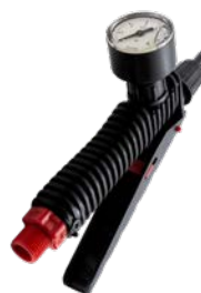
GUARNIZIONE IN VITON