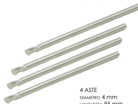
4 ASTE DIAMETRO 4 mm LUNGHEZZA 95 mm