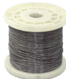
5 m CAVETTO D'ACCIAIO

Sono disponibili a magazzino gli altri elementi per adattare il modulo a seconda di diverse necessità di installazione.