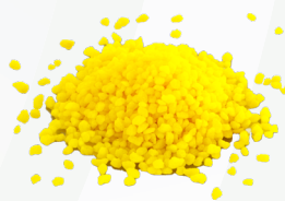
Esca moschicida in granuli

2) Riempirlo con granuli di esca moschicida, quelli che si preferiscono.