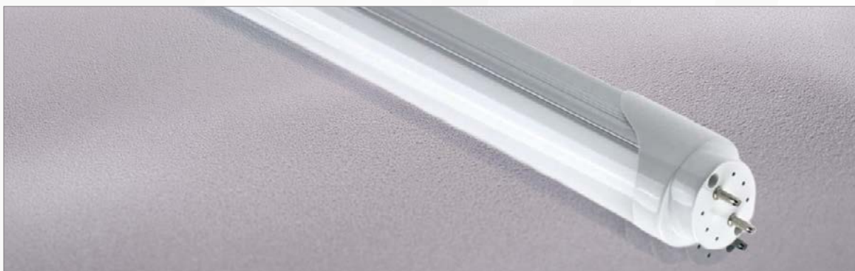
Tubo LED cod. 320LED-TUBO