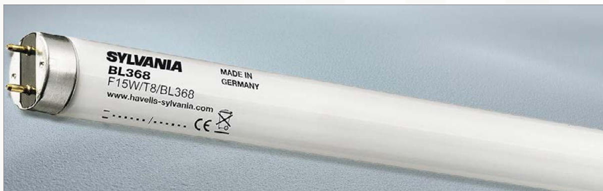
Neon cod. 215LAM