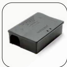
Masterbox Midi (Cod. 137)

Esempi di Box erogatori di sicurezza ORMA: