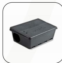
Total Box (Cod. 146)