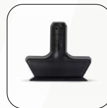
Titan (Cod. 249)