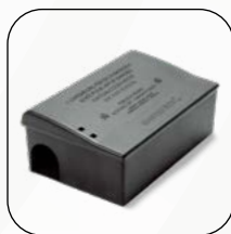
Masterbox Maxi (Cod. 136)