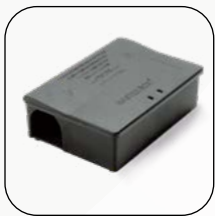
Masterbox Midi (Cod. 137)

Esempi di Box erogatori di sicurezza ORMA: