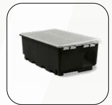
Masterbox Plus (Cod. 243)